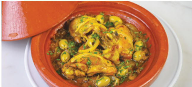
TAGINE DE POULET 130 DH AUX OLIVE ET CITRON CONFIT