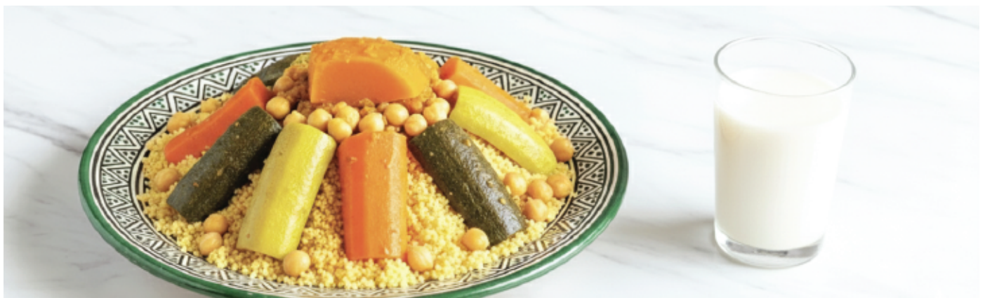
COUSCOUS POULET 100 DH TFAYA + LEBEN