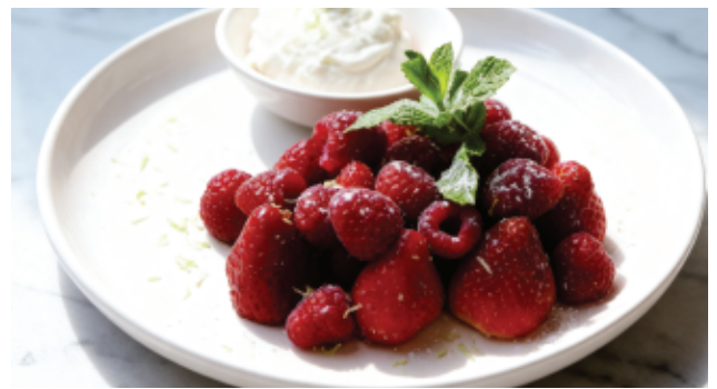
BELLE FRAISES 75 DH & FRAMBOISES FRAICHES CHANTILLY, MASCARPONE, ÉCLATS PISTACHE