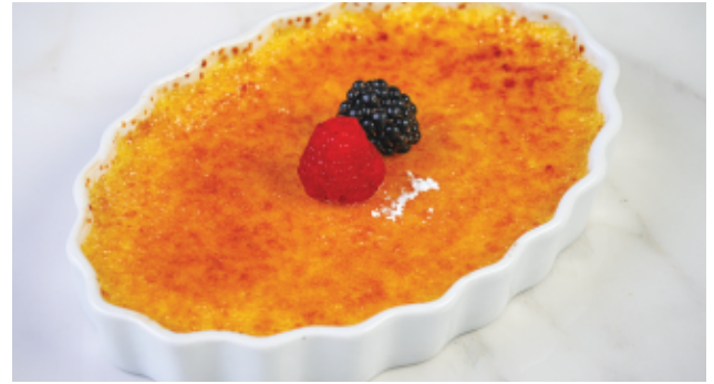
CRÈME BRULÉE VANILLE 80 DH