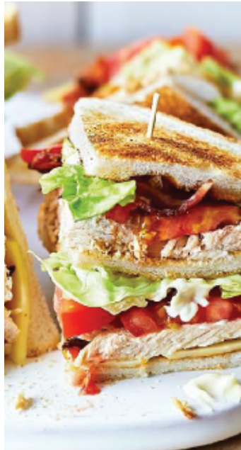
CLUB SANDWICH POULET