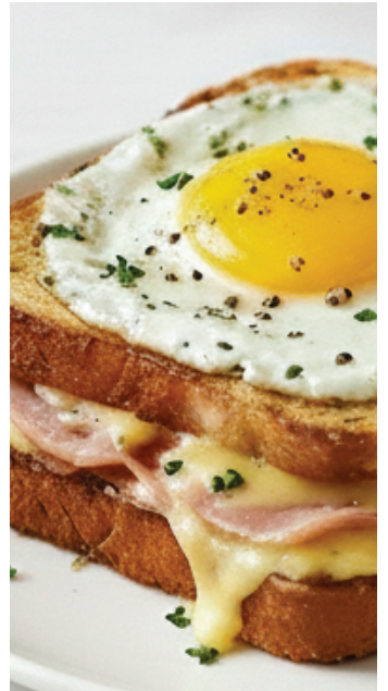
CROQUE MADAME À LA TRUFFE