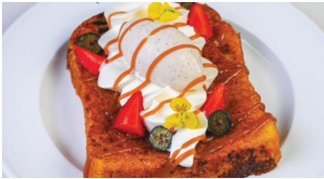
PAIN PERDU AU CAMEL 70 DH FRUIT ROUGE ET GLACE VANILLE