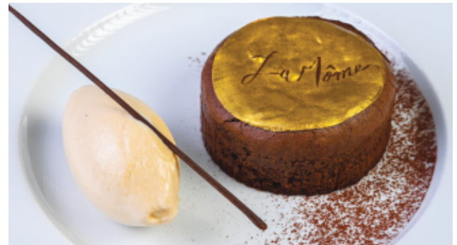
FONDANT CHOCOLAT (15 MIN) 90 DH SIGNATURE

FACON SNICKERS CRÈME GLACÉ CARAMEL ET NOISETTE