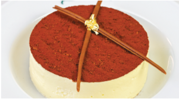
TIRAMISU CAFÉ 75 DH