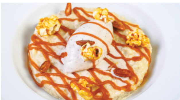
SUNDAE RIZ 90 DH AU LAIT CARAMEL