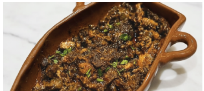
TANGIA MARRAKCHIA 140 DH