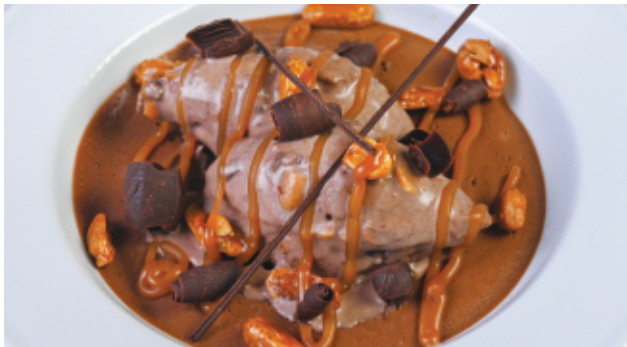
SNICKERS MOUSSE 90 DH AU CHOCOLAT

FACON SNICKERS CRÈME GLACÉ CARAMEL ET NOISETTE