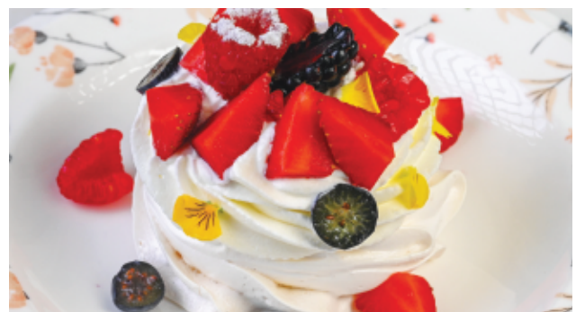
PAVLOVA FRUIT ROUGE 70 DH

MERINGUE, MARMELADE FRUIT ROUGE, SORBET FRAISE, CHANTILLY