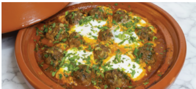
TAGINE KEFTA OEUF 110 DH