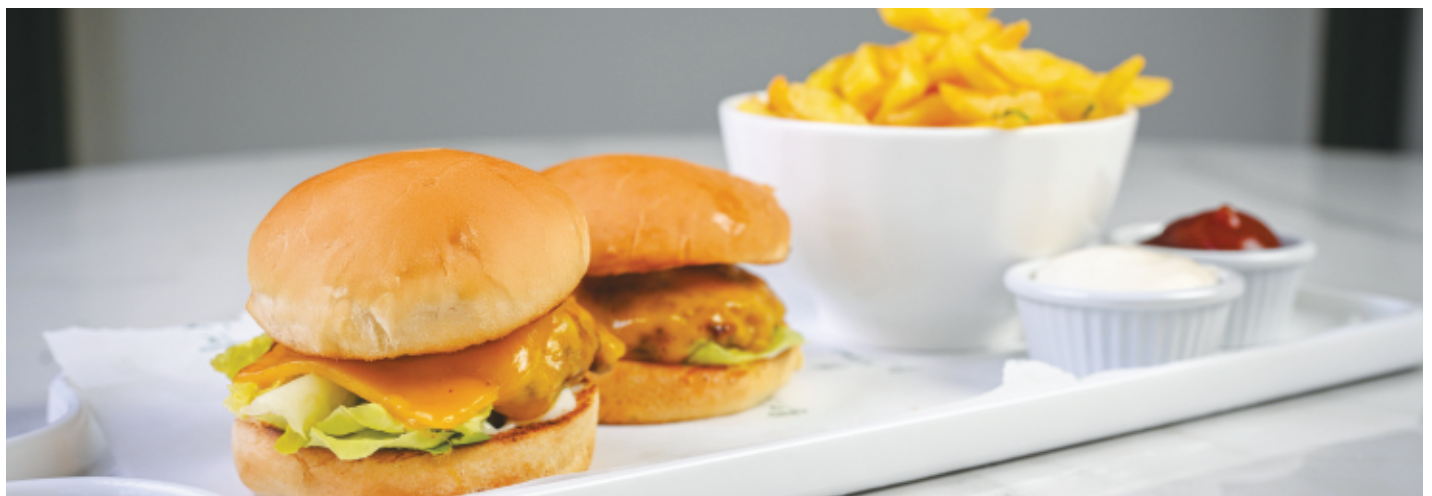
2 PETIT BURGER FRITE ET BOISSON SODA