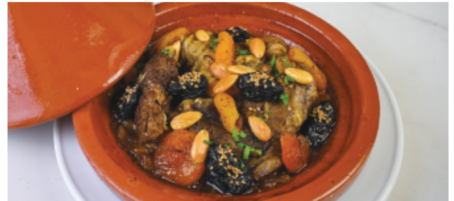
TAGINE DE BŒUF 140 DH AUX PRUNEAUX