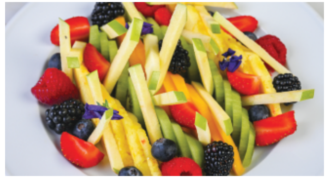
ASSIETTE DE FRUITS 80 DH DE SAISON