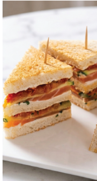
CLUB SANDWICH SAUMON