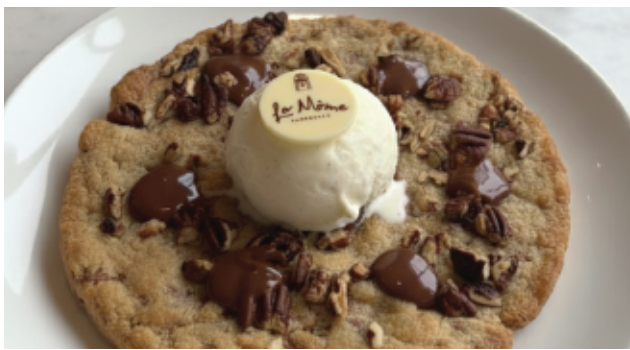
COOKIE TIÈDE 70 DH AVEC GLACE VANILLE CAMEL BEURRE SALÉ & GLACE VANILLE